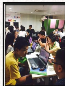
2015年暑期香港医疗交流团小组专案报告讨论留影