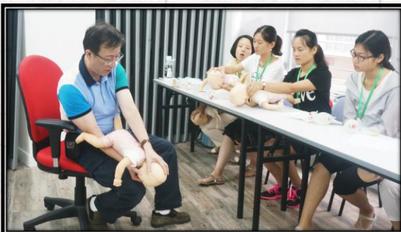
2015年暑期香港医疗交流团BLS课程学习留影