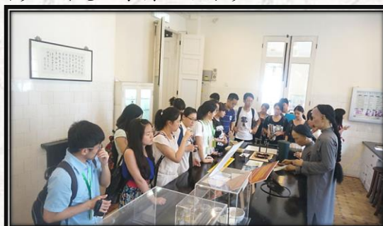
2014年暑期参观香港医学博物馆留影