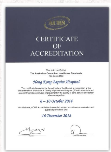
多次荣获「澳洲医疗服务标准委员会」（ACHS）认证

香港浸信会医院由1950年的一所诊所渐渐发展至今天的全科医院。多年来，医院致力拓展多元化服务，包括开设不同的专科医疗中心，致力提升服务质素达国际级水平，满足现今社会对高质素医疗服务的需求。医院提供全面的门诊服务，包括家庭医学、专科及特别门诊，为病人提供全天候的高质素诊断、治疗及护理服务，尤其注重病人身、心、社、灵的需要，致力实践「全人医治」的理念。