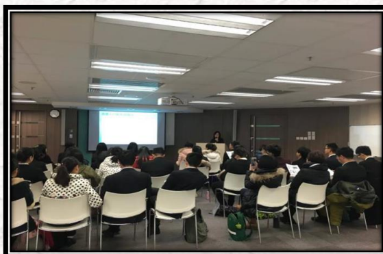
2016年寒假香港医疗零距离交流项目开学典礼