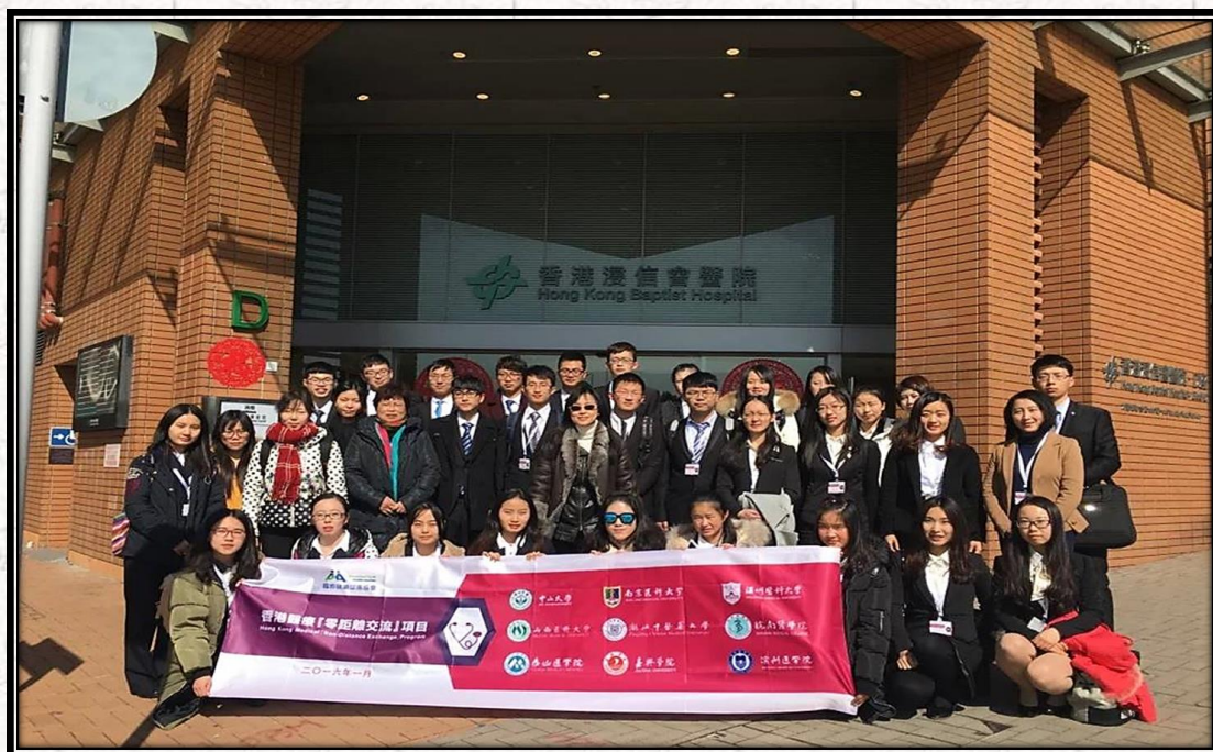
2016年寒假香港医疗零距离交流项目浸信会医院门口留影