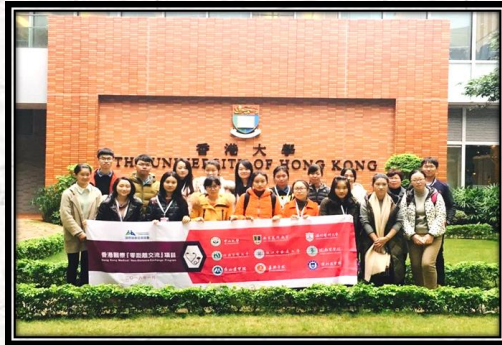
2016年寒假香港医疗零距离交流项目 游览香港大学留影