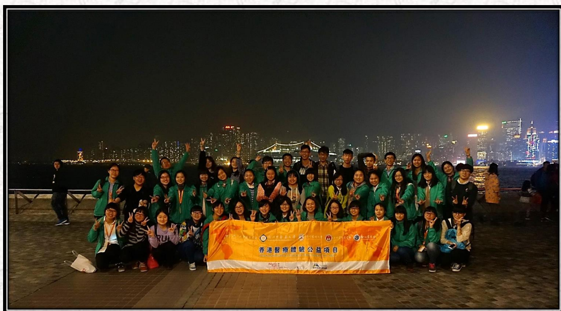
2015年寒假香港医疗交流团参观维多利亚港留影