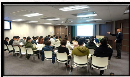
2016年寒假香港医疗零距离交流项目课堂学习留影