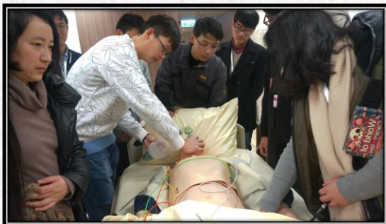
2016年寒假香港医疗零距离交流项目临床技能模拟训练留影