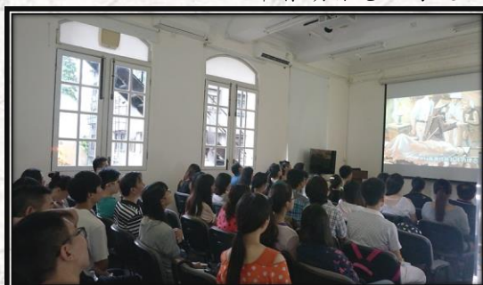
2015年暑期参观香港医学博物馆留影