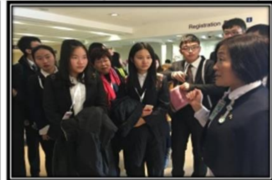
2016年寒假香港医疗零距离交流项目参观医院留影