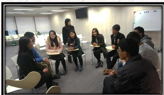
与来自香港医学生面对面交流与讨论