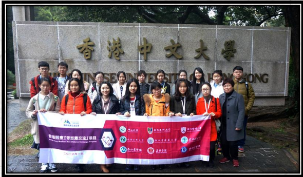
2016年寒假香港医疗零距离交流项目 游览香港中文大学留影