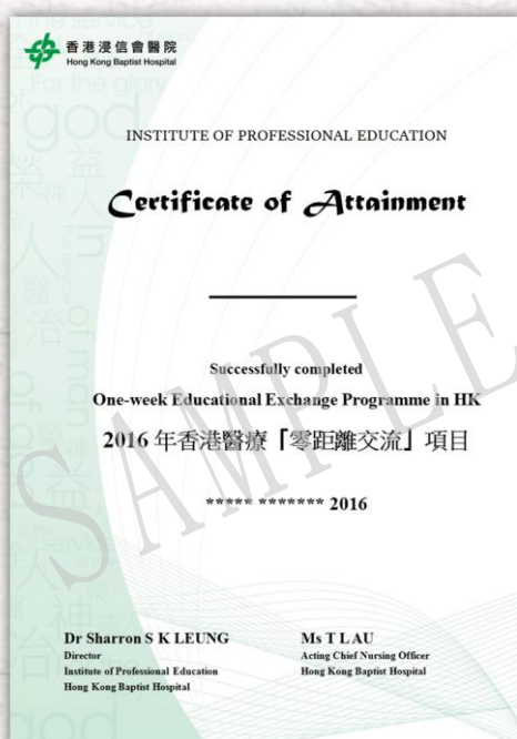
香港医疗「零距离交流」项目证书样本